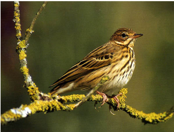
Baumpieper Anthus trivialis

Wieslandnutzung und Beweidung extensivieren, Säume entlang von Waldrändern und Bachläufen stehen lassen, Einzelbäume erhalten und fördern.