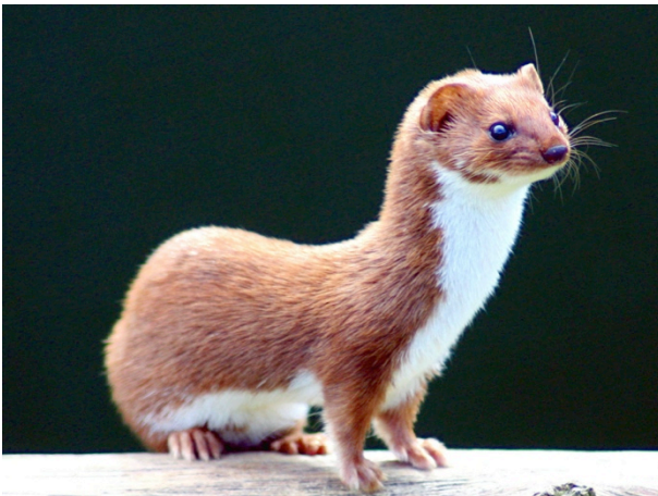
Mauswiesel Mustela nivalis

Wiesel brauchen mehrere Kleinstrukturen in unmittelbarer Nähe voneinander. Es sollen Ast- und Steinhaufen mit sperrigem Material an Waldrändern angelegt werden.