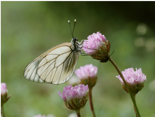
Baumweissling Aporia crataegi

Intensive Landwirtschaft bedrängt den Lebensraum des Baumweisslings. Förderung extensiv bewirtschafteter Flächen mit Hecken, Gehölzen und buschigen Waldrändern. Aufwerten von Hecken und Waldrändern (selektive Pflege, Anpflanzungen).