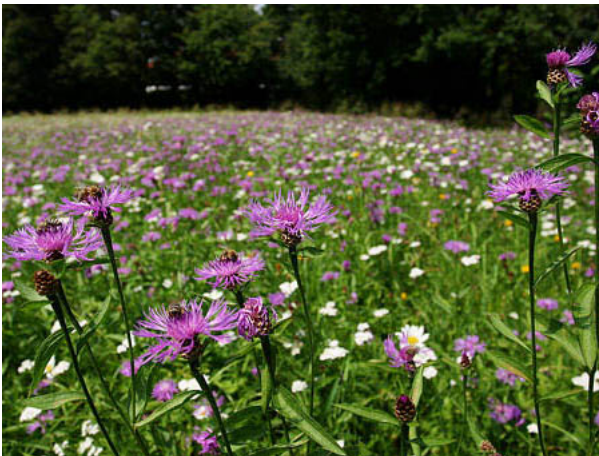
Blumenwiese mit Wiesen-Flockenblume Centaurea jacea

Extensive Nutzungsformen fördern. Gezielte Ansaaten an artenarmen Extensivstandorten. Rückführen von vergandeten Flächen. Feuchte Standorte fördern, Düngeeintrag vermeiden.