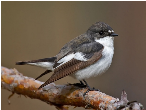
Trauerschnäpper Ficedula hypoleuca

Erhalten von alten Obstgärten (Höhlenangebot) mit strukturreicher Umgebung. Unternutzen des Obstgartens extensivieren (Nahrungsangebot). Pflanzen neuer Hochstamm-Obstbäume. In der Nähe weitere naturnahe Flächen oder Strukturen schaffen. Geeignete Nisthilfen anbringen (Nistkästen).