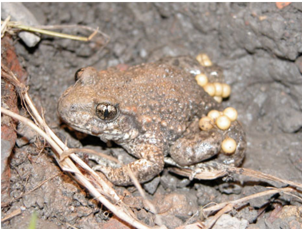
Geburtshelferkröte Alytes obstetricans

Extensive Pflege sicherstellen. Erhalten und Schaffen von zusätzlichen Laichgewässern und zielgerichtete Gestaltung des Landlebensraumes. Offene Bodenstellen und Kleinstrukturen fördern.