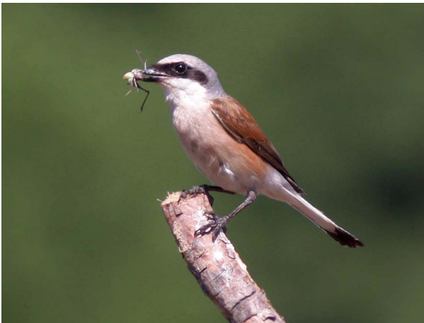
Neuntöter Lanius collurio

Hecken als Biodiversitätsförderflächen anmelden und selektiv pflegen (Hasel auf Stock setzen, Dornensträucher stehen lassen). Heckensäume extensiv nutzen (die Hälfte wird stehen gelassen). In der Nähe von Dornenstrauchhecken die Nutzung extensivieren. Dornenstrauchreiche Niederhecken neu anpflanzen.