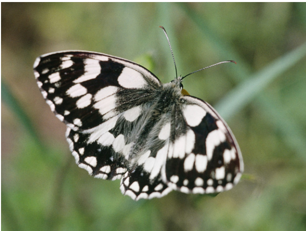
Schachbrettfalter Melanargia galathea

Grünlandextensivierungen. Schonendes Mahdverfahren mit Balkenmäher, Staffelmahd. Sehr extensive und späte Beweidung. Anlegen von Säumen, Brachen, Ruderalflächen und Altgras.