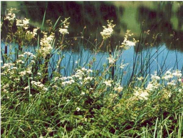
Feuchter Saum mit Spierstaude Filipendula ulmaria

Extensive Nutzungsformen fördern. Keinen Dünger einsetzen. Aufkommende Gehölze entfernen.