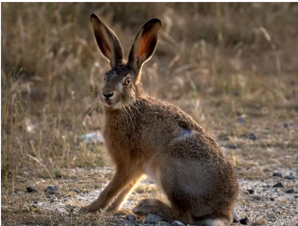
Feldhase Lepus europaeus

Eine strukturreiche Landschaft ist für den Feldhasen notwendig. Säume entlang von Bachläufen, Brachestreifen und Hecken dienen ihm als Schutz und als Trittstein in andere Lebensräume. Bei der Mahd sollen kleine Inseln als Versteckmöglichkeiten stehen gelassen werden.