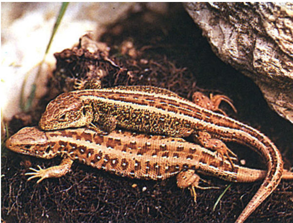
Zauneidechse Lacerta agilis

Schaffen von Kleinstrukturen wie Steinhäufen, Wurzelteller, Asthaufen. Sie dienen als Sonnplätze und können das Habitat aufwerten. Säume anlegen. Fördern von trockenen und gut besonnten Extensivwiesen (u. a. für Zauneidechse). Schonend mähen, Teile der Vegetation bei der Mahd stehen lassen. Waldränder aufwerten, Totholz aufschichten.