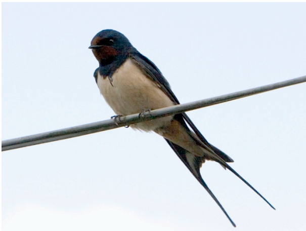
Rauchschalbe Hirundo rustica

Nistgelegenheiten einrichten oder Kunstnester montieren. Zugänge frei halten. Offene Bodenstellen an Böschungen und Uferanrisse zulassen (Lehm als Nistmaterial für Schwalben). In Gebäudenähe Biodiversitätsförderflächen, welche ein hohes Futterangebot garantieren, anlegen.