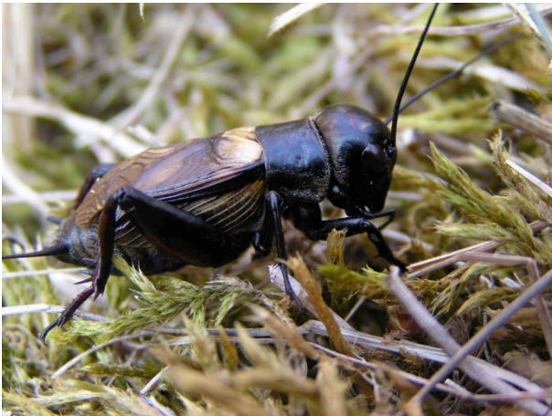
Feldgrille Gryllus campestris

Magerweiden nur kurz und abschnittsweise beweiden. Halbtrockenrasen extensiv nutzen mit später Sommermahd, Verbrachung vermeiden. Überständigkeit, Einfaulen vermeiden.